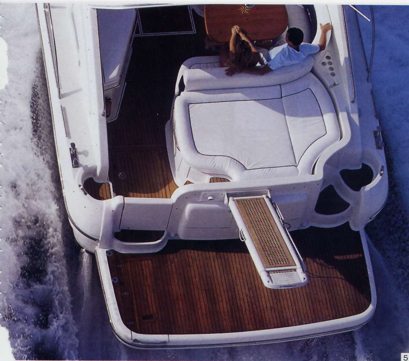
5. Il nuovo Rio 47 Cruiser è dotato di un'ampia plancetta con passerella telescopica. Da qui si può passare al passavanti di destra che conduce a prua. Dietro al divano si nota il grande prendisole di poppa.